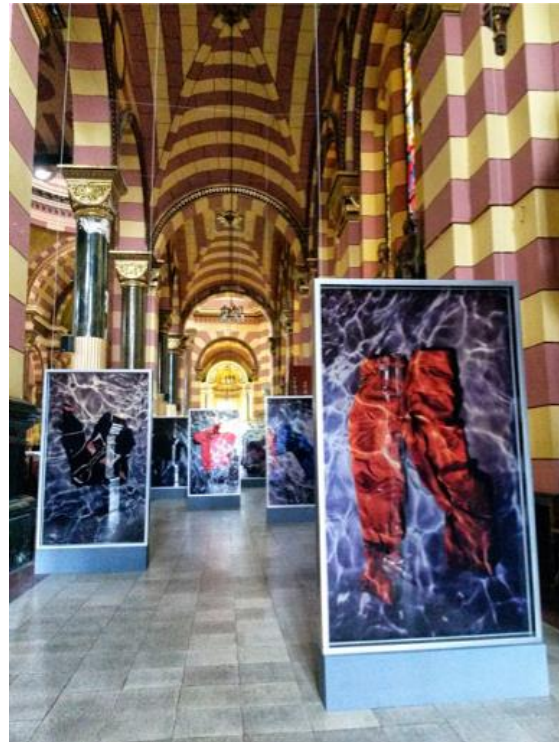
Erika Diettes, “Río abajo”

Ante este hecho, la obra de Diettes construye una estrategia de restitución simbólica: devolverles a los dolientes la posibilidad de elaborar un duelo. Las fotografías de “Río abajo” son de prendas usadas en vida y cuidadas delicadamente por los familiares de las víctimas, como si aún vivieran: lavadas, planchadas, guardadas con cuidado como si en algún momento fueran a aparecer sus propietarios. Pero eso no sucederá y el acto de la espera evidencia la prolongación en el proceso de la elaboración del duelo. Tanto el lugar de exhibición, como el formato y el contenido de la fotografías, evidencian la intención de Diettes: por un lado, fotografiar las prendas hundidas en agua, pero no en un agua turbulenta que arrastra y elimina los cuerpos, sino inmersas en un agua calmada (en oposición con la corriente del río), translúcida y luminosa y, por otro lado, mediante la elección del soporte utilizado para las fotografías: una impresión en vidrio de gran formato que da transparencia a lo fotografiado. Sumado a lo anterior, la serie de fotografías instaladas en la iglesia parecen vitrales y, por lo tanto, se insertan automáticamente en la iconografía de lo sagrado y en el silencio solemne del templo.