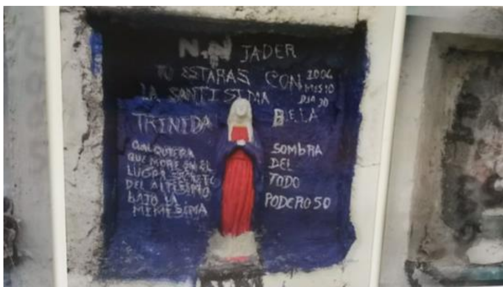
Juan Manuel Echavarría, “Requiem NN”

La serie de Echavarría hace un seguimiento de este ritual mediante un registro fotográfico tomado en dos o más tiempos. Entre una imagen y la otra se logra ver la intervención que las personas hacen en la sepultura: las inscripciones, las flores, las imágenes sagradas, los favores pedidos y las gracias por los recibidos. Estas tumbas son un indicio de la barbarie y testimonian no solo el crimen sino el dolor de los familiares de desaparecidos. En algunos