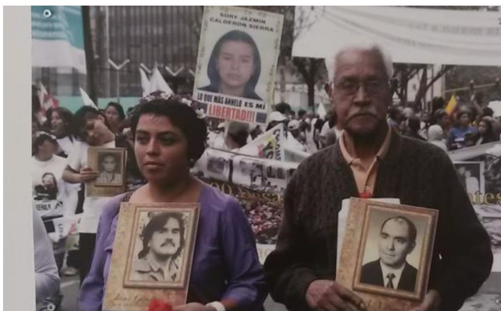
Fundación Nydia Erika Bautista “Prohibido olvidar a los desaparecidos”

Por una vía semejante se construye el proyecto “Prohibido olvidar” de la Fundación Nydia Erika Bautista. La exposición está compuesta por un archivo fotográfico y textual que recoge tanto las marchas como los relatos de las familias de los desaparecidos. Por un lado, la presencia de los desaparecidos mediante sus retratos; por el otro, el testimonio de los