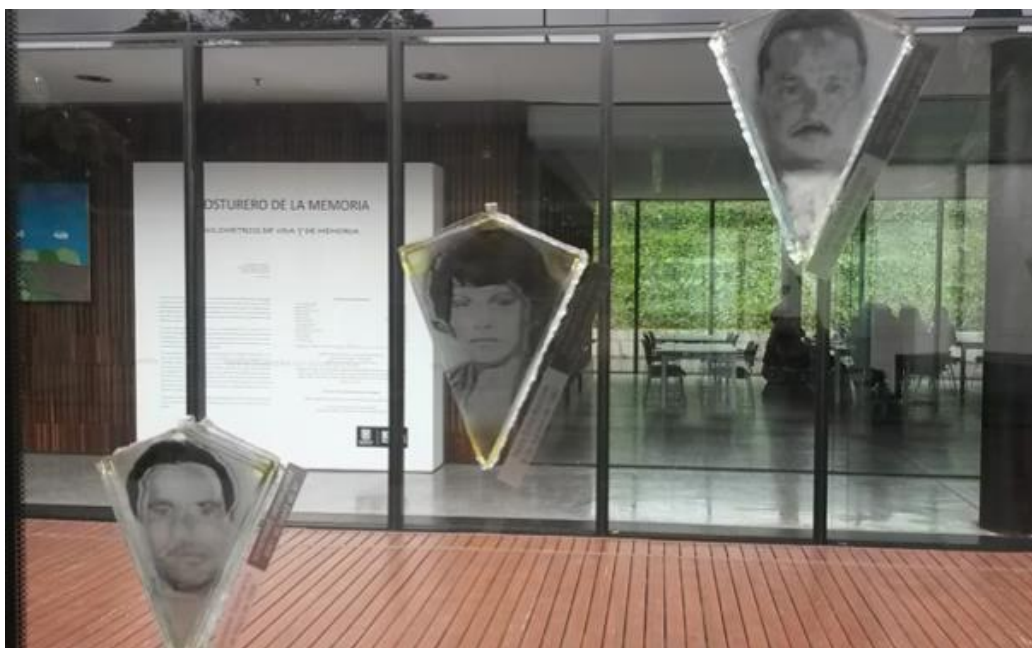
“Galería partes” (Asfaddes)

Ahora bien, recordemos que las imágenes de la exposición en su conjunto son cualitativamente diferentes (obras de “autor” y obras colaborativas). Las primeras buscan explorar dimensiones formales, estructurales, etc., mientras que las segundas buscan documentar procesos. Tal vez, las primeras buscan hacer que algo (ausente) se haga presente mediante las huellas indiciales, mientras que las segundas buscan representar (una ausencia) mediante las fotografías de los desaparecidos. Podría pensarse que en el arte participativo, lo que nos muestran las imágenes es la evidencia icónica de una ausencia, los rostros de las personas desaparecidas y ejecutadas extrajudicialmente. Y no es un azar, por lo tanto, que los monumentos conmemorativos en los que se reconocen los sobrevivientes sean marcadamente miméticos y representacionales. De ahí que las imágenes (predominantemente fotográficas) acudan a las formas representacionales del centramiento y la frontalidad del retrato, propias de la fotografía popular y, a su vez, de las fotografías judiciales y de identificación ciudadana. La elocuencia de estas imágenes radica en que los