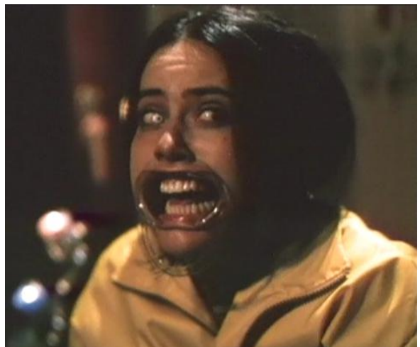
Frica secuestrada y torturada por El Pato. Min, 22:00

Otra de las características que hace tan especial el primer corto es la inclusión de elementos propios del género del terror. Martínez Montalbán se ha referido al tema en varias ocasiones y ha señalado que en las últimas décadas, desde películas como Alien , el