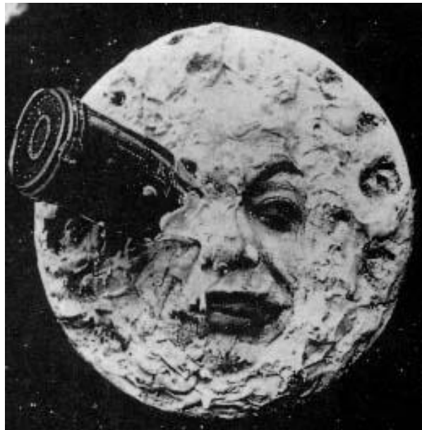
Le Voyage dans la Lune (Viaje a la Luna) 1902. Una de las primeras películas de ciencia ficción de la historia.

En contraste con las actuales producciones los primeros largometrajes de ciencia ficción mantenían una constante de mediocridad y deficiente ingenio que dejaba al género muy lejos de la escena cinematográfica mundial en la que cobraban valor el drama, el terror, el suspenso y el western americano. Ya acotaba José Luis Martínez Montalbán a finales del siglo pasado en uno de los artículos más arriesgados sobre el tema titulado Entre la ciencia y la ficción que “las películas del género se planteaban como productos de relleno para los