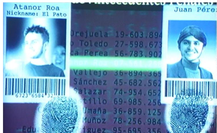
Intercambio de identidades entre El Pato y Juan Pérez, Min. 11:20.

Lo que más llama la atención en el escenario futurista elaborado por el creador es la irrupción de la tecnología vista como algo cotidiano, con un papel protagónico que va a determinar el desarrollo de la historia. Como ya lo ha propuesto Hal Foster en El Retorno a lo Real , lo que se da un es cambio determinante entre “la era de la revolución cibernética en los sesenta y la