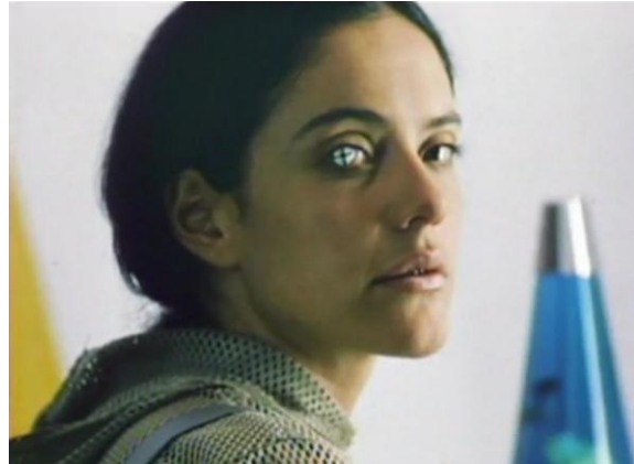
Frica. Bogotá 2016 Min. 4:18

Frica es una reportera bogotana del año 2016 cuya mayor pretensión es hacer televisión real transmitiendo en vivo, para lo cual cuenta con dos implantes tecnológicos: un lente de contacto que cumple la función de cámara de video y un brazalete instalado en su brazo a manera de prótesis que le permite transmitir en directo. Su gran trabajo es la entrevista que pretende hacer a Juan Pérez , un personaje simple que vive en el