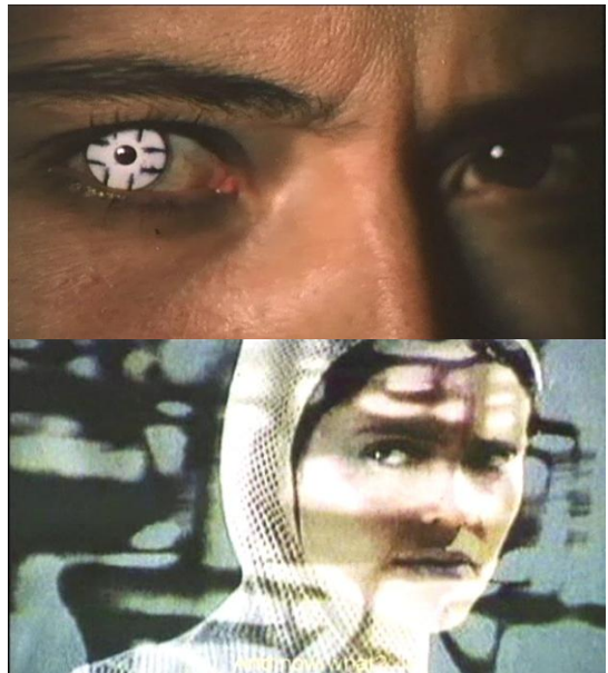
Frica transmitiendo con el lente-cámara. Min. 22:22

Con esta óptica Frica es un ciborg de la Bogotá del año 2016, conectada por medio de dispositivos desarrollados gracias a la nanotecnología como el lente de contacto y la manilla con los cuales puede transmitir desde cualquier parte. Lleva incorporado a su cuerpo la cámara y el transmisor que le permite comunicar lo que pasa en la ciudad, que registran la realidad e incluso le permiten sentir placer simplemente conectándose por medio de un cable al monitor en el que se proyecta la imagen de su amiga virtual. Otra perspectiva que resulta apenas perceptible en nuestra sociedad actual pero que manifiesta la visión futurista de los creadores colombianos de finales de siglo XX es la conexión-desconexión que viven los ciudadanos en un mundo invadido por la virtualidad. Foster lo deja en claro y plantea que “este cableado [Internet, fotografía, televisión, cine] lo que nos conecta y nos desconecta simultáneamente, nos hace a la vez psicotecnológicamente inmediatos a los acontecimientos y geopolíticamente remotos de ellos.” 7 En la actualidad estos elementos se han convertido en pan de cada día, pero viendo un poco hacia atrás resulta sorprendente que uno de los precursores del cine de ciencia ficción colombiano haya pensado en una ciudad virtual, conectada y desconectada usando los términos de Hal Foster, muy similar a la que de hecho se vive hoy en día.