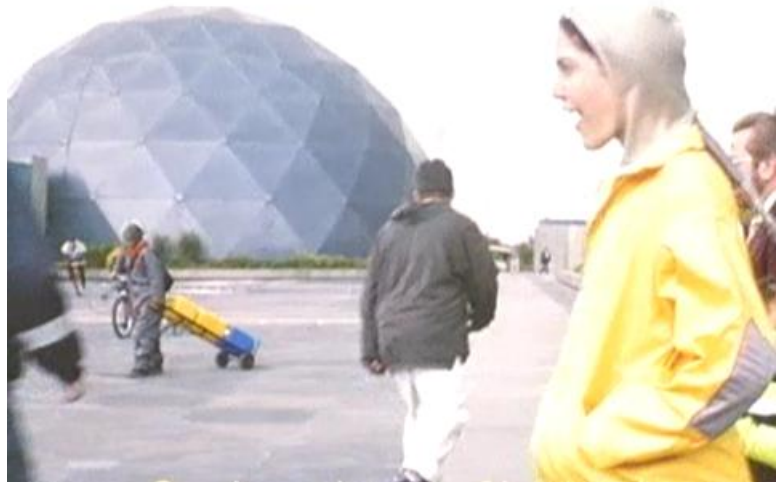
Imagen de Bogotá en el 2016. Min. 5:30

Algo similar ocurre con los espacios de la ciudad ejemplificados a través de las referencias al barrio “Antanas” o Antiguo Teusaquillo y la inconfundible imagen del domo de Maloka Centro Interactivo , que hacen que el espectador se sienta en la ciudad, pero en una ciudad del futuro, transformada por diversas problemáticas y procesos