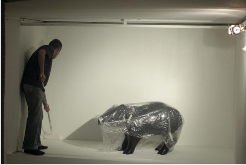
Foto del montaje de la obra "Danta" de Luis Antonio Gaona. Museo de Arte Moderno de Bogotá.