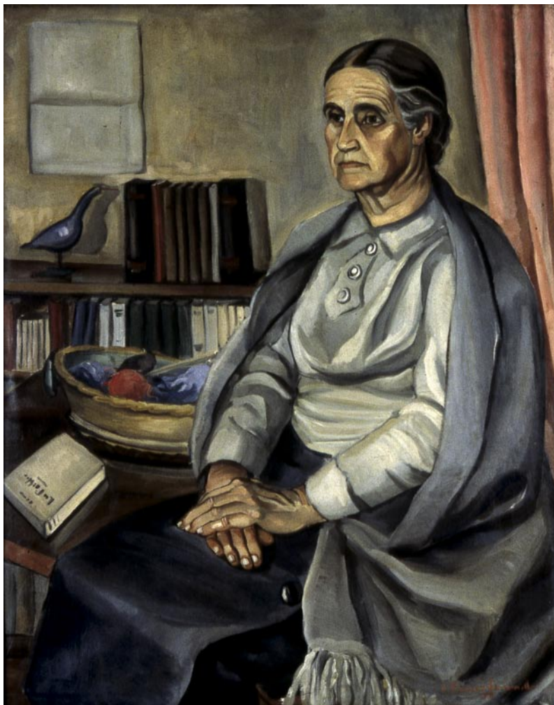
La madre del pintor